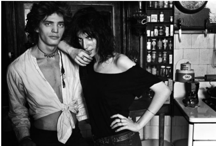
Mapplethorpe with Patti Smith.

In short, his hagiographer, Mapplethorpe tells us , or you take it all, raw and true, without making excuses, or that Mapplethorpe you appreciate is just a mental trip of yours that he would hate, with which he surely played.